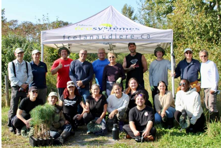
Activité de plantations du 13 septembre 2024 avec La Hutte

Durant l'été et l'automne, six activités éducatives familiales ont eu lieu dans les deux réserves naturelles de la FiCEL à Sainte-Émèlie-de-l'Énergie et à L'Assomption. Au menu : découverte des écosystèmes forestiers et des milieux humides, trucs et astuces pour identifier les arbres, conseils pour fabriquer un herbier, plantation et fabrication d'hôtels à insectes et de nichoirs à chauves-souris. À la Vallée de la rivière Noire, la cabane à sucre opérée par la FiCEL, Carcajou, s'est transformée pour l'occasion en atelier pour ébénistes, grands et petits. Ces activités se sont tenues en partenariat avec le Conseil régional de l'Environnement de Lanaudière, grâce à une subvention du CREVALE (Comité régional pour la valorisation de l'éducation).