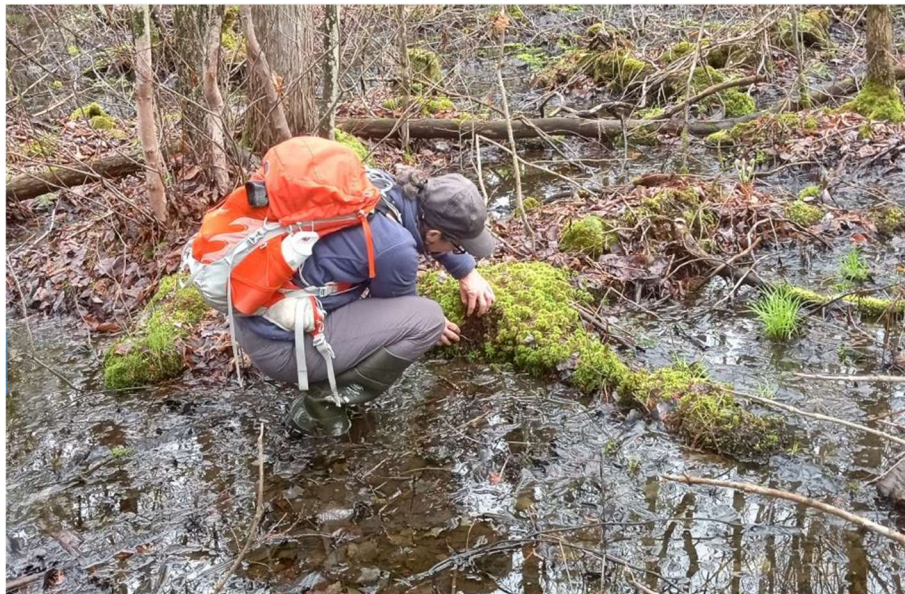
Inventaire de salamandres à quatre orteils

L'année 2024 a aussi été chargée en inventaires et en suivis biologiques. Une campagne intensive de recherche de mares propices à la reproduction de la salamandre à quatre orteils, une espèce à statut précaire, a d'abord occupé l'équipe tôt au printemps (photo), suivie en juin par le suivi des sites de ponte de la tortue des bois sur l'un des sites protégés par la FiCEL.