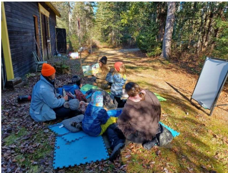
Activité éducative à la Vallée de la rivière Noire, 2 novembre 2024

Durant l'été et l'automne, six activités éducatives familiales ont eu lieu dans les deux réserves naturelles de la FiCEL à Sainte-Émèlie-de-l'Énergie et à L'Assomption. Au menu : découverte des écosystèmes forestiers et des milieux humides, trucs et astuces pour identifier les arbres, conseils pour fabriquer un herbier, plantation et fabrication d'hôtels à insectes et de nichoirs à chauves-souris. À la Vallée de la rivière Noire, la cabane à sucre opérée par la FiCEL, Carcajou, s'est transformée pour l'occasion en atelier pour ébénistes, grands et petits. Ces activités se sont tenues en partenariat avec le Conseil régional de l'Environnement de Lanaudière, grâce à une subvention du CREVALE (Comité régional pour la valorisation de l'éducation).